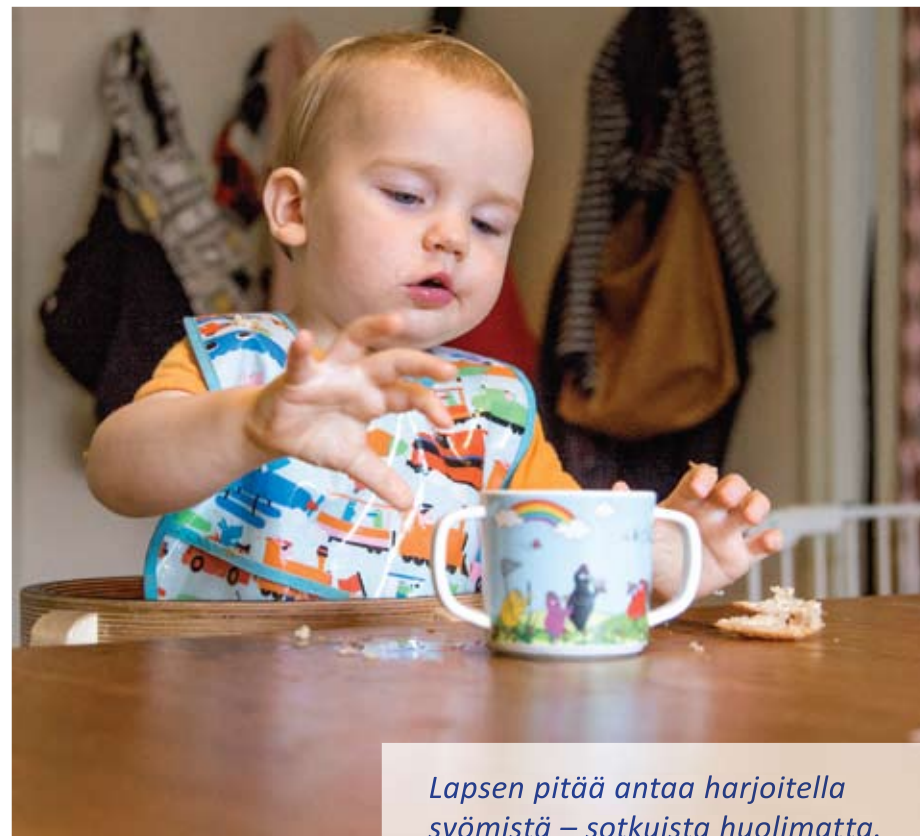
Lapsen pitää antaa harjoitella syömistä – sotkuista huolimatta.

Lapsi oppii kuivaksi parhaiten silloin, kun pottajuttuihin ei kiinnitetä liikaa huomiota. Virtsarakon ja suolen hallinta edellyttää hermoston kehittyneisyyttä, ja lapsi saavuttaa tämän vaiheen aikaisintaan toisen ikävuoden lopulla. Joku oppii asian varhemmin, toinen myöhemmin. Lapset ovat tässäkin asiassa yksilöllisiä, eikä lasta pidä verrata toisiin samanikäisiin. Lapsi voi tulla istua potalla, jos se on hänestä muka-